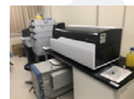
全自動前処理 LCMS分析システム 全自動 LCMS前処理装置 CLAM-2030 高速液体クロマトグラフ質量分析システム LCMS-8050