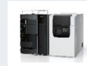
高速液体クロマトグラフ 質量分析システム LCMS-2020

また、大学の教員、学生による研究活動に使用されるだけでなく、地域の企業にも活用を促すことで、SPARQプログラムを通じて地域社会の発展に貢献しています。