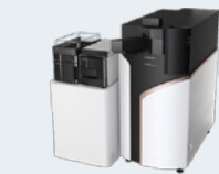
四重極飛行時間型 高速液体クロマトグラフ 質量分析システム LCMS-9050