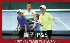
親子 P&S 17日・24日の両日共(8:30~)