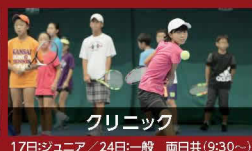
クリニック 17日:ジュニア / 24日:一般 両日共(9:30~)