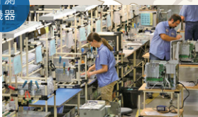
Shimadzu U.S.A. Manufacturing, Inc.