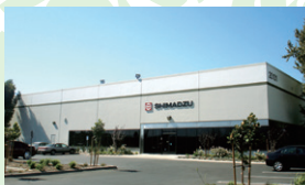
Shimadzu Medical Systems USA