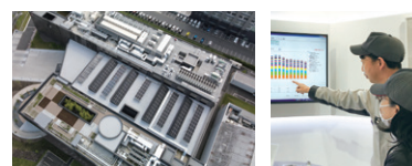
再生可能エネルギー使用

太陽光発電などの再生可能エネルギーの積極的な導入や、スマートメーターを設置した消費電力の見える化による省エネ施策を強化するとともに、サプライチェーン全体での環境負荷低減に努めます。