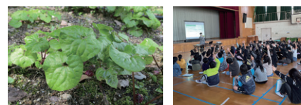
「島津の森」のフタバアオイ

生物多様性保全のための森づくり活動や学校での環境教育授業の実施など、地域や教育機関・団体と連携し、幅広い活動を展開します。