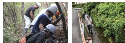
ボランティア社員参加の森活動

社員全員が「環境貢献企業 島津」の一員として、さまざまな環境活動に積極的に取り組みます。