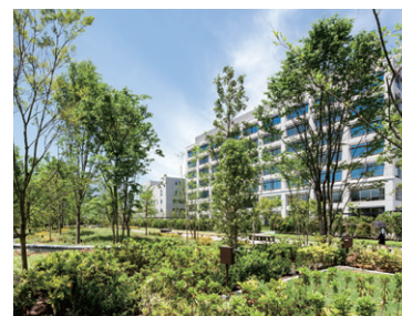
本社三条工場内「島津の森」

ハビタット評価認証とは、日本生態系協会が生物多様性の保全や回復に資する取り組みを客観的に評価し認証するものです。本社三条工場の「島津の森」は京都府で初の最高ランク「AAA」評価を取得しています。