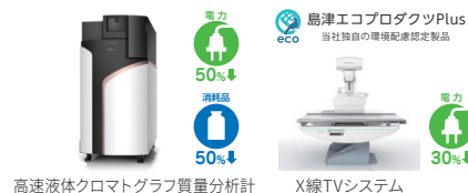
高速液体クロマトグラフ質量分析計

環境・新エネルギー分野において、カーボンニュートラルに向けた開発課題を解決する製品や技術を提供します。すべての製品について常に省エネや小型化などを図り、製品ライフサイクルを通じた環境負荷の低減を推進します。