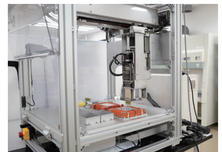
培養肉自動生産装置（試作機）