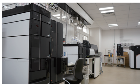
NARO島津テストングラボ

当社と国立研究開発法人農業・食品産業技術総合研究機構（農研機構：NARO）は、2019年に共同研究契約を締結し、当社内に「食品機能性解析共同ラボ（NARO島津ラボ）」を設置。2022年には農研機構と食による健康長寿社会の実現を目指す「セルフケアフード協議会」を設立し、当社は事務局をしています。2023年には健康につながる食品・飲料開発を支援する「NARO島津テストングラボ」を開設しました。農産物などの機能性・安全性の検証や、健康食品・飲料の研究開発と迅速な社会実装を支援しています。