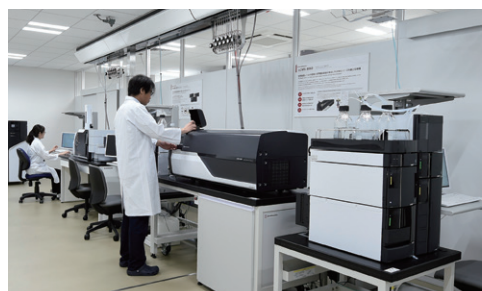
食品機能性解析共同研究ラボ「NARO島津」