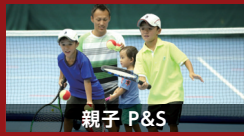
親子 P&S 17日・24日の両日共(8:30~)