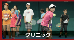
クリニック 17日:ジュニア / 24日:一般 両日共(9:30~)